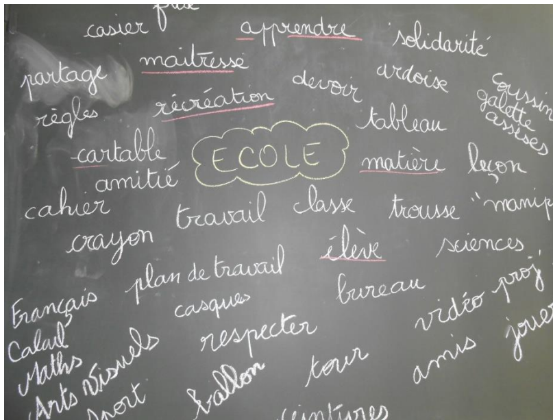
Brainstorming de la classe de CE2-CM1